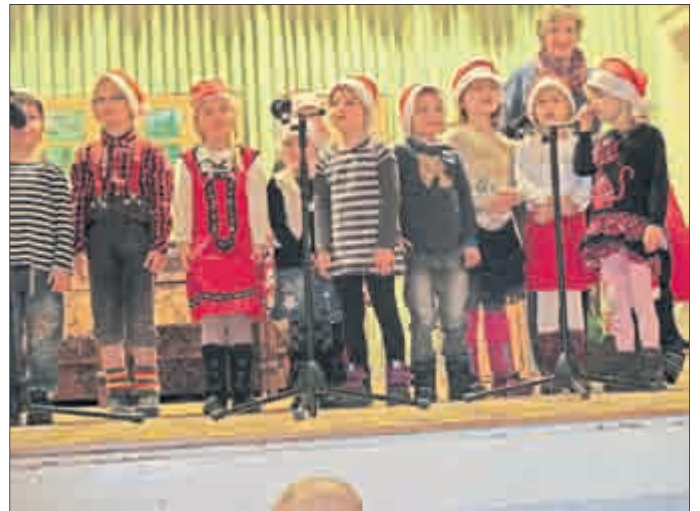
Die „Wachsenburgzwerge“ grüßten mit einem feinen Programm