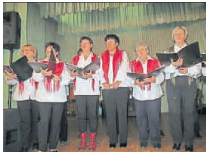
Viel Beifall für den Holzhäuser Frauenchor.