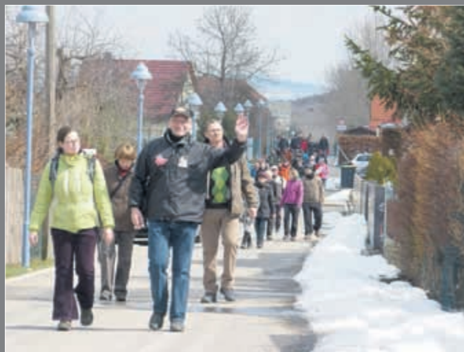
Bilder: Kulinarische Erlebniswanderung 2013, Stadtmarketing Arnstadt GmbH