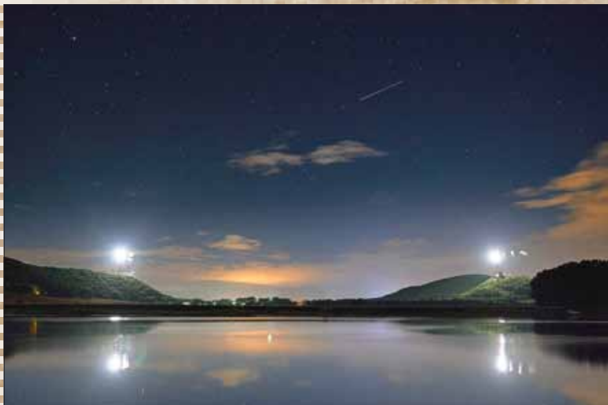
„Der große See“ - 2. Platz - vergeben an Herrn Maximilian Heller aus Ilmenau