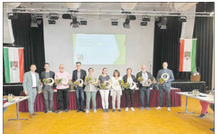
Die ausgeschiedenen Gemeinderäte

Die Neuwahl der Gemeinderäte und Ortsteilbürgermeister im Amt Wachsenburg zeigt das Engagement und das Interesse der Bürger an der Gestaltung ihrer Gemeinde.