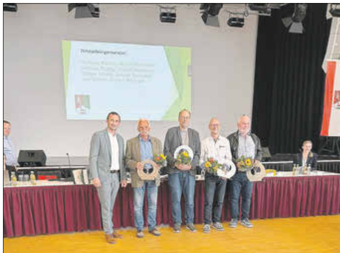
Die ausgeschiedenen Ortsteilbürgermeister