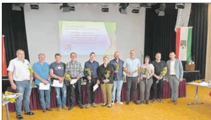
Die neugewählten Ortsteilbürgermeister