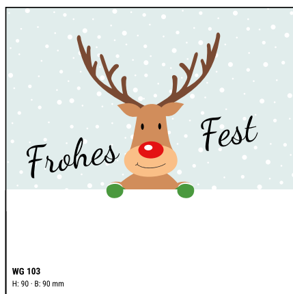
WG 103 H: 90 · B: 90 mm