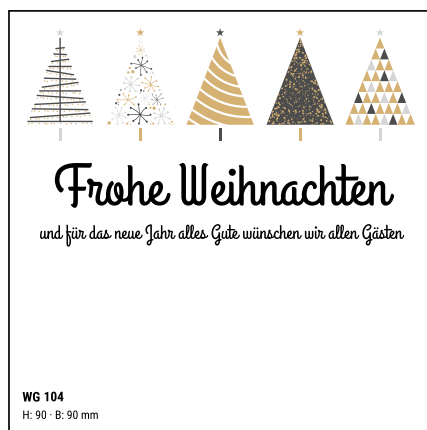
WG 104 H: 90 · B: 90 mm