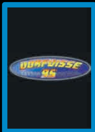
DJ Dorfdisse 95