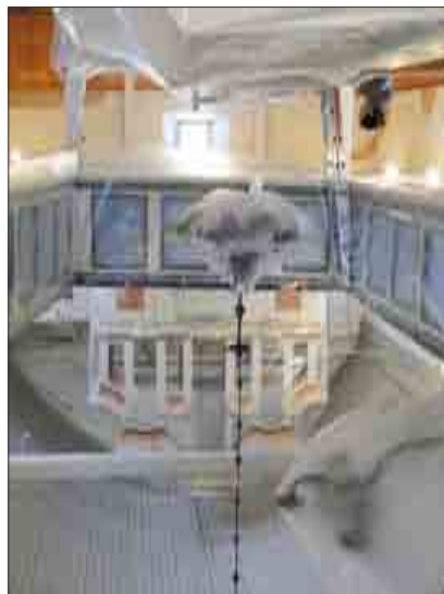
Baustelle Dreifaltigkeitskirche