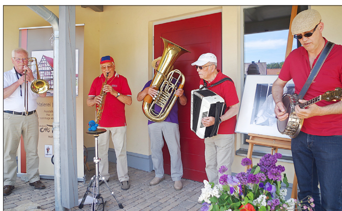
Die Arnstädter Stadtmusikanten sorgten für gute Stimmung