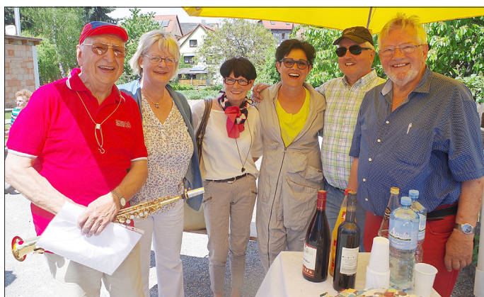
Mitglieder der Familie Hartung waren zur Ausstellungseröffnung gekommen