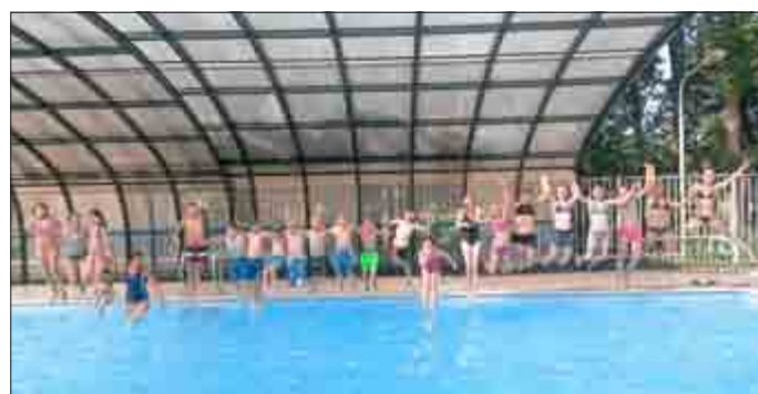
Im Pool des Summercamps Heino