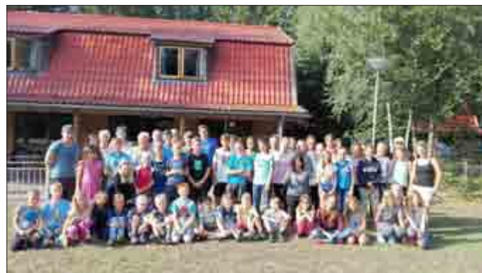
Gruppenfoto: Kinder und Jugendliche der Gemeinde Amt Wachsenburg

(Jugendpflegerin der Gemeinde Amt Wachsenburg)