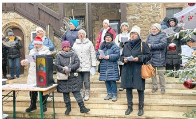
Brandtal-Lerchen aus Holzhausen