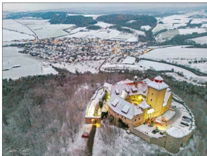
Die Wachsenburg und Holzhausen