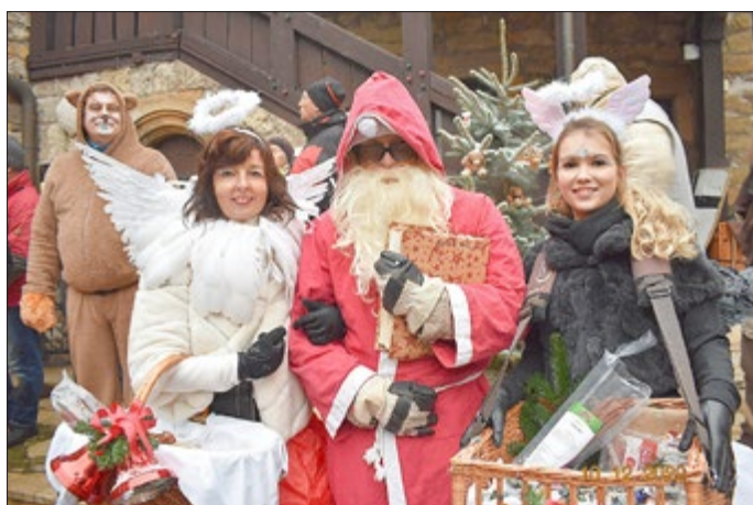
Weihnachtsengel und Weihnachtsmann begrüßten die Besucher