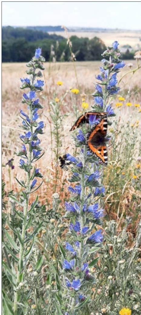
Blühender Feldrain als Insektenweide.