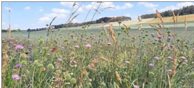
Neuer Feldrain am Ilmtal-Radweg bei Kleinhettstedt (Ilm-Kreis) im Juni 2022.