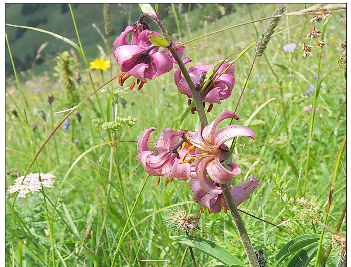
Foto einer Türkenbundlilie

Wichtig ist aber vor allem, dass die Bedeutung des Drei Gleichen Gebiets als einzigartiger Hotspot der Biodiversität anerkannt und wertgeschätzt wird, wozu wir mit diesem Artikel gerne beitragen möchten. Nur durch den Erhalt der Artenvielfalt in Zusammenhang mit einer Vernetzung der wertvollen Biotope können wir langfristig die wichtigen Ökosystemdienstleistungen sichern, die die Natur für uns erbringt. Doch dies erfordert ein Umdenken beim Umgang mit unserer Natur und unser aller Engagement für einen nachhaltige und lebenswerte Zukunft.