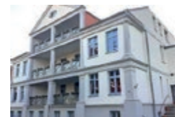
Gruppenhaus Herrmann 17

Träger: ABW e.V., Erfurter Straße 42a, OT Ichtershausen, 99334 Amt Wachsenburg