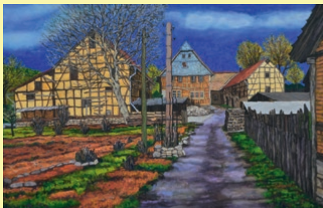
Gehöft in Sundremda, Acrylfarbe 2022