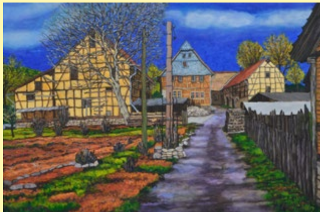
Gehöft in Sundremda, Acrylfarbe 2022