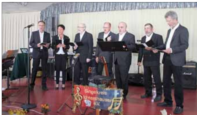
Männerchor aus Arnstadt