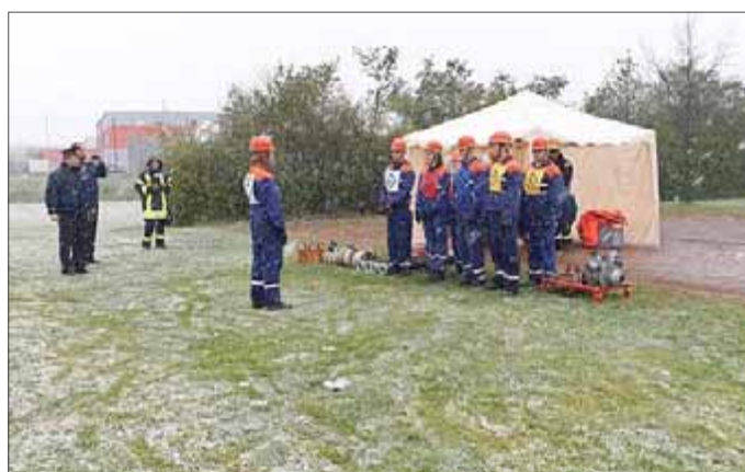
Die zweite Disziplin war Kugelstoßen, hier errichtete die Mannschaft trotz schlechter Wetterbedingungen eine sehr gute Punktzahl. Im Anschluss erfolgte ein Aufbau eines Löschangriffes nach FwDV 3.