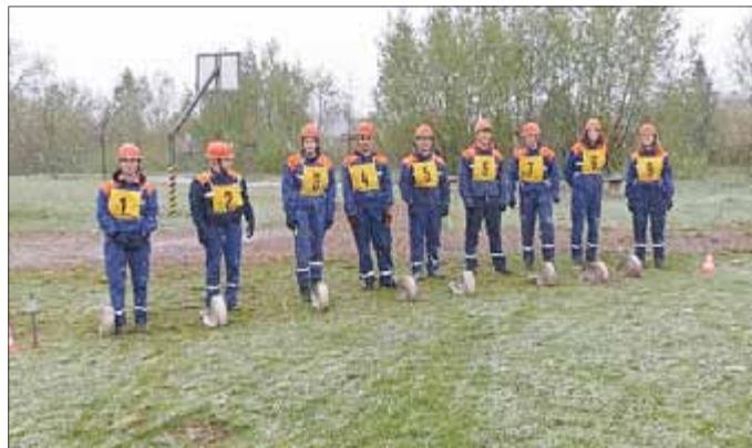
Die erste von 5 Disziplinen war die Schnelligkeitsübung. Dabei musste eine Schlauchstrecke von 120 m unter 75 sec. ohne Verdreher ausgelegt und gekuppelt werden.