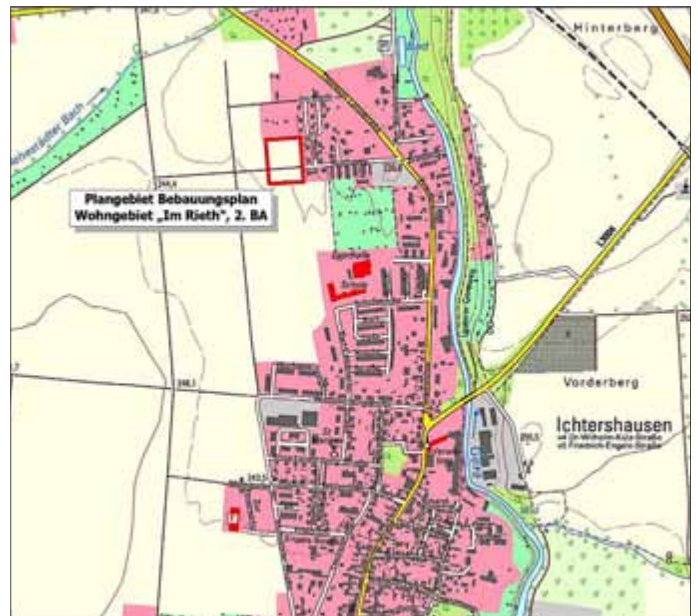
Übersichtskarte ohne Maßstab

Es wird darauf hingewiesen, dass der Bebauungsplan gemäß § 13b BauGB im beschleunigten Verfahren ohne Durchführung einer Umweltprüfung nach § 2 (4) BauGB aufgestellt wird. Gemäß § 4a (6) BauGB wird zudem darauf hingewiesen, dass Stellungnahmen, die nicht rechtzeitig abgegeben worden sind, bei der