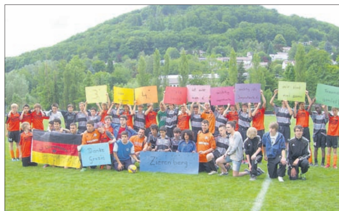
Mannschaftsfoto im Spiel um Platz 3 Auf den Schildern steht auf Deutsch und Italienisch: „3. oder 4. Platz ist nicht wichtig. Wichtig ist: Wir sind Freunde!“