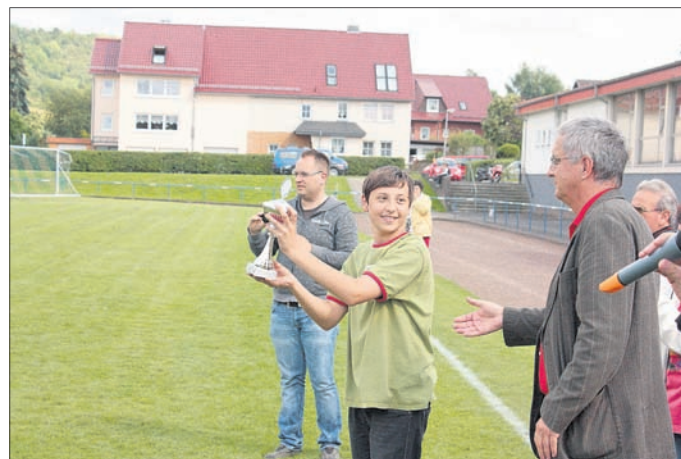
Pokal für Platz 3