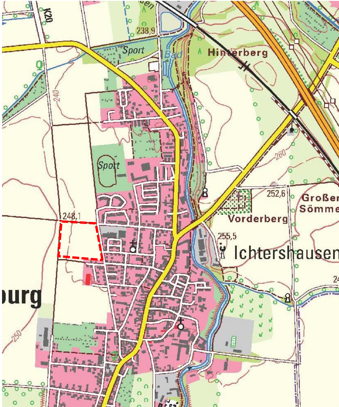
Abb. 1: Übersichtslageplan des geplanten Wohngebietes (rot gestrichelter Umring) auf Basis der TK25 (unmaßstäblich)

Das Plangebiet des Bebauungsplanes „Molsdorfer Straße II“ liegt am westlichen Ortsrand von Ichtershausen, direkt angrenzend an die Verkehrsfläche der Molsdorfer Straße. Es stellt eine straßenbegleitende Erweiterung der östlich und südlich angrenzenden Wohnbebauung dar und wird von Siedlungsflächen gefasst. Das südlich liegende Wohngebiet „Molsdorfer Straße“ entwickelte sich seit der Rechtskraft des Bebauungsplanes im Jahr 2006.