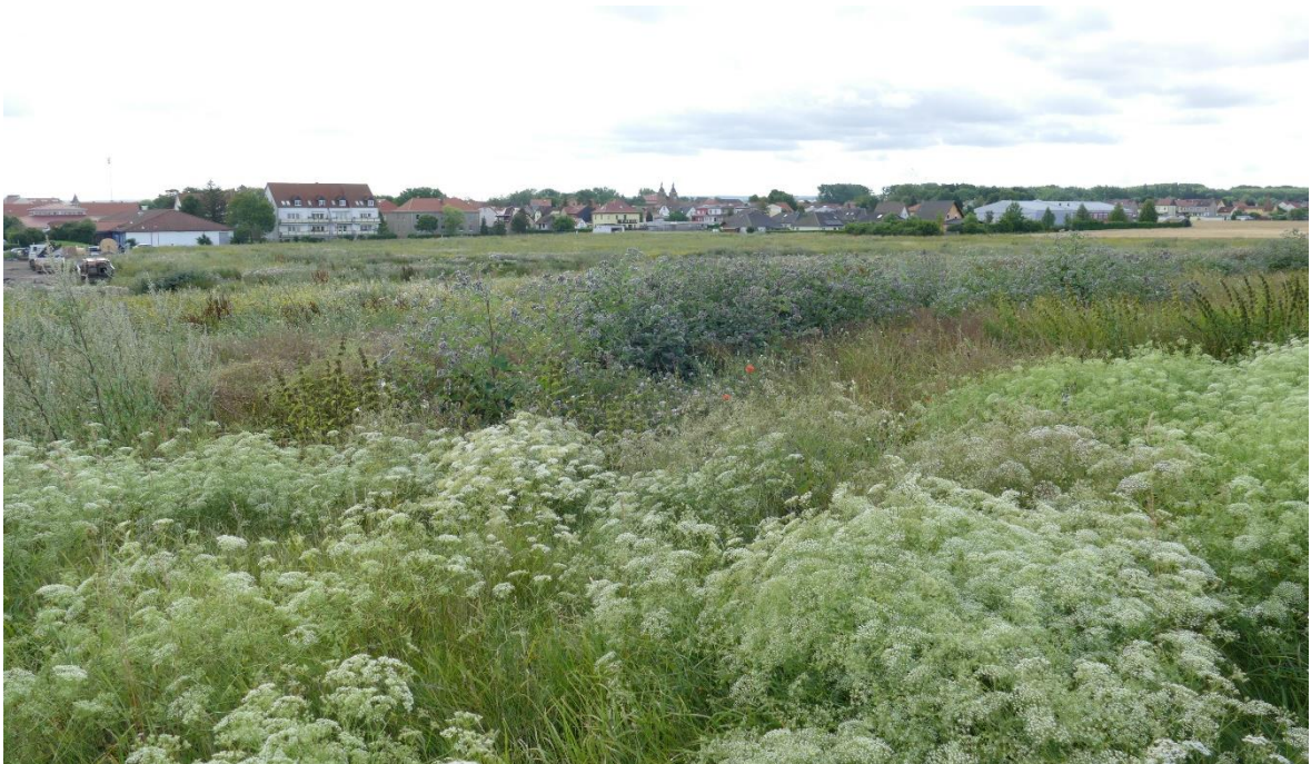
Abb. 5: Blick von der Nordwestecke über das Plangebiet nach Südosten

Der Acker war im Jahr 2024 aufgelassen, jedoch von weit verbreiteten und ubiquitären Segetal-, Ruderal- und Saumarten besiedelt. Lediglich an den Wegrändern sind ganz vereinzelt Gehölze vorhanden. Dabei dominiert der Schwarze Holunder.