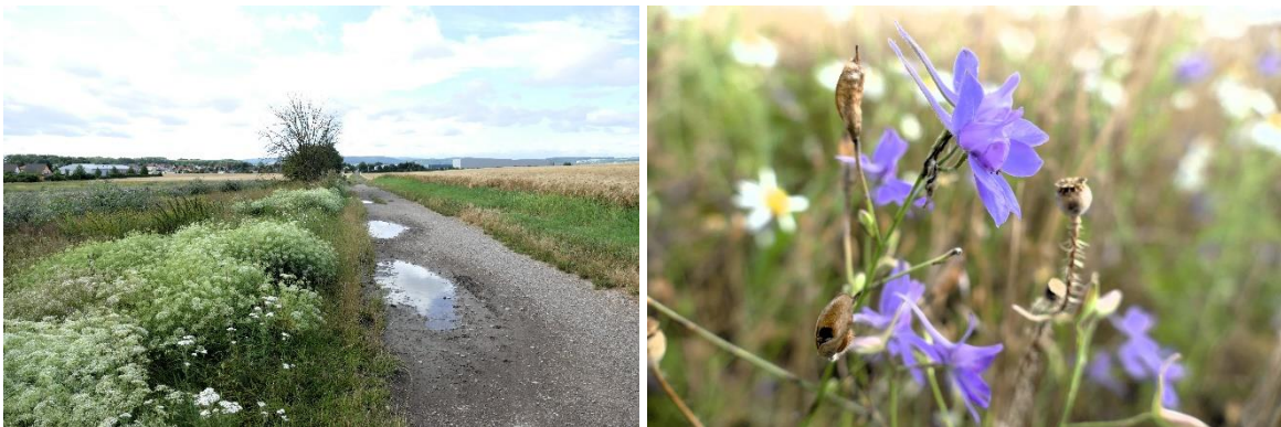
Abb. 8 & 9: Westlich begrenzt der Feldweg „An den Herbstwiesen“ das Plangebiet. Hier sind am Weg auch einzelne Sträucher zu finden (links), rechts der gefährdete Feld-Rittersporn

Als einzige relevante geschützte und/oder gefährdete Art wurde der Feld-Rittersporn Consolida regalis (RLD 3, RLT V) festgestellt. Diese Art ist in der Umgebung von Arnstadt an den Ackerrändern noch relativ häufig anzutreffen. Die Art ist einjährig und jedes Jahr an anderen Stellen zu finden. Der Verlust einzelner Exemplare führt für diese Art hier nicht zur Beeinträchtigung der Gesamtpopulation, zumal die Art an den nördlich und westlich angrenzenden Ackerrändern häufig war.