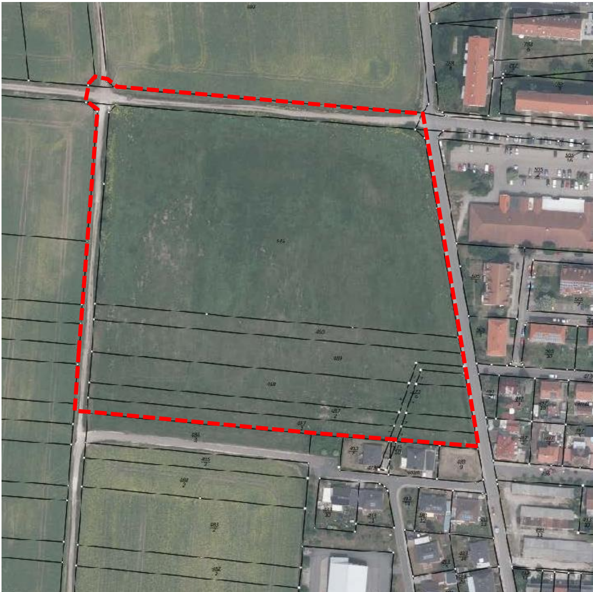
Abb. 3: Lageplan des Plangebietes (rot gestrichelter Umring) auf Basis des Luftbildes mit Kataster (Quelle: Thüringen Viewer, unmaßstäblich)

Das Plangebiet selbst nimmt derzeit bis auf die integrierten derzeitigen Feldwege (verlängerte Wachsenburgstraße, sowie Weg „An den Herbstwiesen“) vollständig Acker ein.