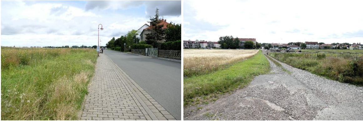
Abb. 6 & 7: Die östliche Begrenzung bildet die Molsdorfer Straße (links) und im Norden befindet sich ein Feldweg in Verlängerung der Wachsenburgstraße rechts)