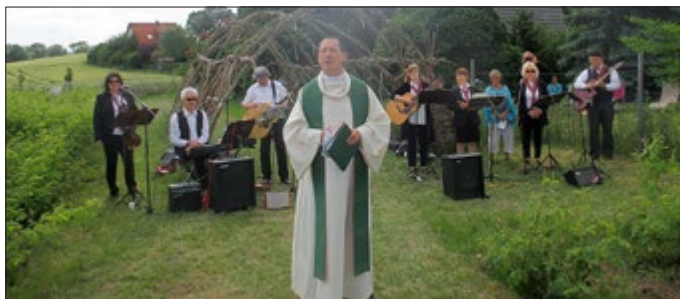
Gottesdienst im Freien

Geöffnet ist der Rosenhof mittwochs bis sonntags von 14 bis 17 Uhr. Anmeldung unter www.rosenhof-holzhausen.de