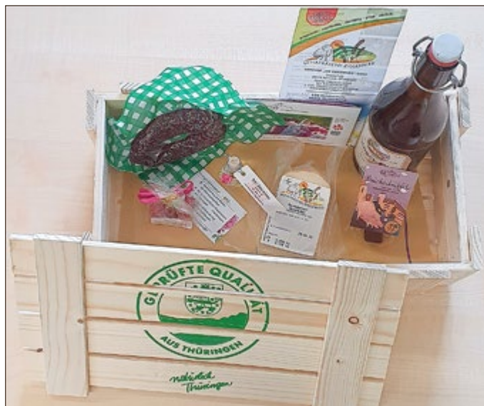
Kiste mit regionalen Produkten aus den Landkreisen Gotha und Ilm-Kreis

Das Thüringer Regional Regal ist nach der Förderung durch die RAG vom Land weiter gefördert worden, um eine thüringenweite Strategie für den Vertrieb und die Logistik regionaler Produkte zu erarbeiten. Um dies umzusetzen, hat sich kürzlich auch der Regionalbündnis e.V. gegründet.