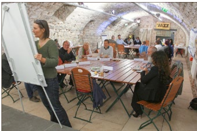
Raddialog im Prinzenhof Arnstadt;